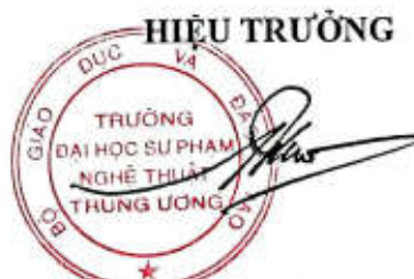
PGS.TS. Đào Đăng Phụng